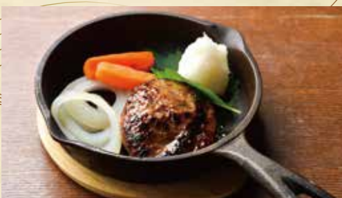
道産和牛100%ハンバーグ