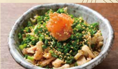
大人のパリパリとり皮ポン酢